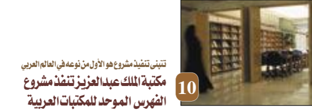
تتبنى تنفيذ مشروع هو الأول من نوعه في العالم العربي مكتبة الملك عبدالعزيز تنفذ مشروع الفهرس الموحد للمكتبات العربية

من مشاريع الفهرس العربي الموحد، مارك العربي