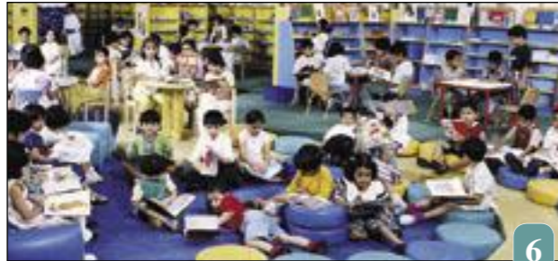
عقب ترؤس سموه مجلس إدارة مكتبة الملك عبدالعزيز العامة الأمير عبد الله يوجه بتسخير كافة الإمكانيات لإنجاح مشروع الفهرس الموحد